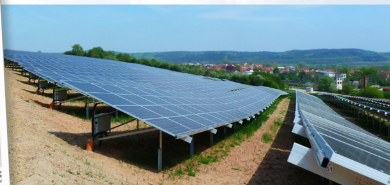
PV Anlage Gerstungen im Besitz des CC Solar Vier

2011 betrug die Leistung von installierten PV Modulen bereits über 20 Gigawatt, Tendenz weiter steigend. Deutschland ist damit weltweit Spitzenreiter. Neben einer nachhaltigen Gesetzgebung sind klare Investitionsrichtlinien, ein stabiles politisches Umfeld, transparente Genehmigungsverfahren und vernünftige Preisstrukturen die herausragenden Kennzeichen des deutschen PV Marktes.