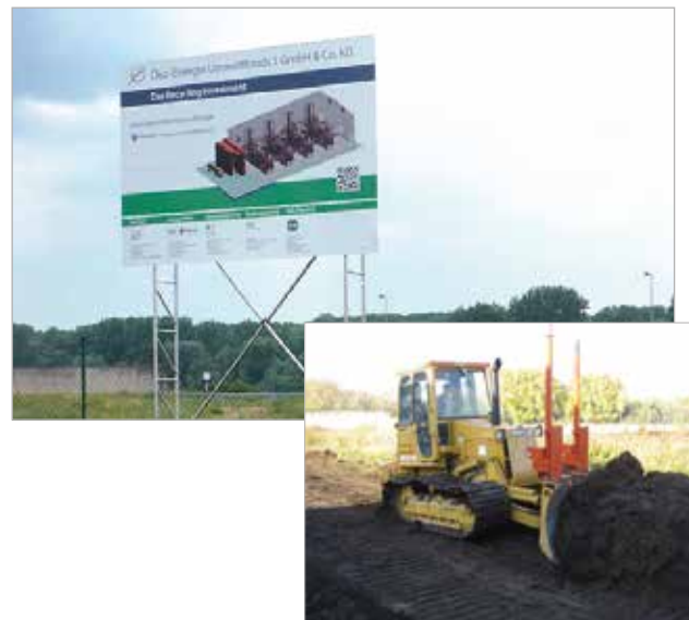
Grundstück im Rheinhafen der Stadt Mannheim

Das Genehmigungsverfahren ist abgeschlossen, der Pachtvertrag für die geplante Kunststoff-Öl-Recycling-Anlage ist unterzeichnet und der Spatenstich erfolgte im Juli 2012. Erste vorbereitende Arbeiten auf dem Baugrundstück sind ebenfalls bereits erfolgt.