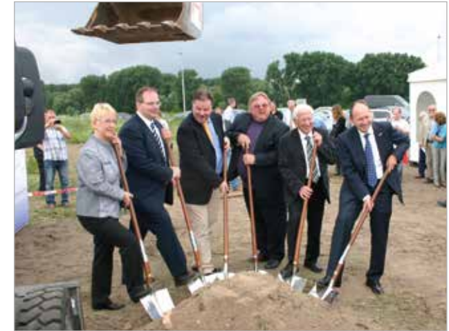
Offizieller Spatenstich im Juli 2012

Das produzierte Öl kann unmittelbar in der Region Mannheim vermarktet werden. Auch logistisch ist dieses Projekt nachhaltig durch kurze Lieferwege für An- und Abtransport der Rohstoffe und des produzierten Öls.