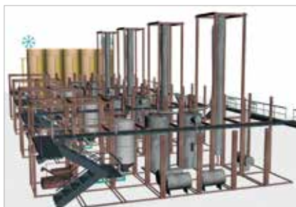
Zeichnung Innenansicht Kunststoff-/Öl- Recycling-Anlage

Neben den beschriebenen Vorteilen sollten Investoren berücksichtigen, dass es sich bei der Vermögensanlage um eine unternehmerische Beteiligung handelt, die zur Minderrendite für den Investor bis hin zum Teil- bzw. Totalverlust seiner Einlage führen kann. Anteile an geschlossenen Fonds sind lediglich eingeschränkt fungibel und übertragbar.